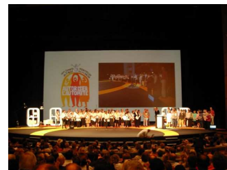
Rendez-vous dans 2 ans à Clermont-Ferrand