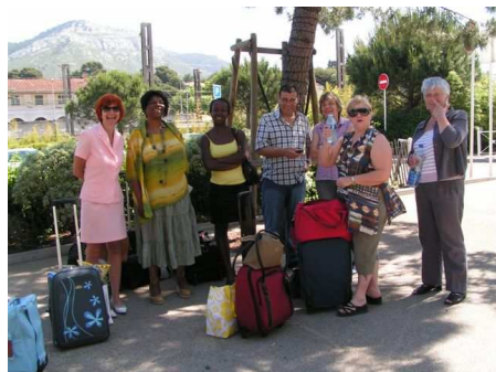
Au départ de TOULON

Bonne ambiance, bon esprit - une excellente organisation - un congrès riche - 1 700 participants venus de tous horizons.