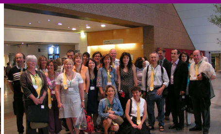
Délégation de notre Apel académique à l'arrivée à Montpellier