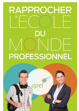
L'Apel s'engage avec son réseau Ecole et Monde Professionnel

La plaquette « Rapprocher l'école du monde professionnel » est à votre disposition à l'Apel.